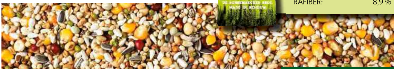
FINESSE CONDITION - 20 KG