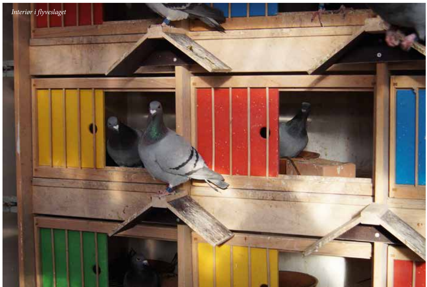
Interior i flyveslaget