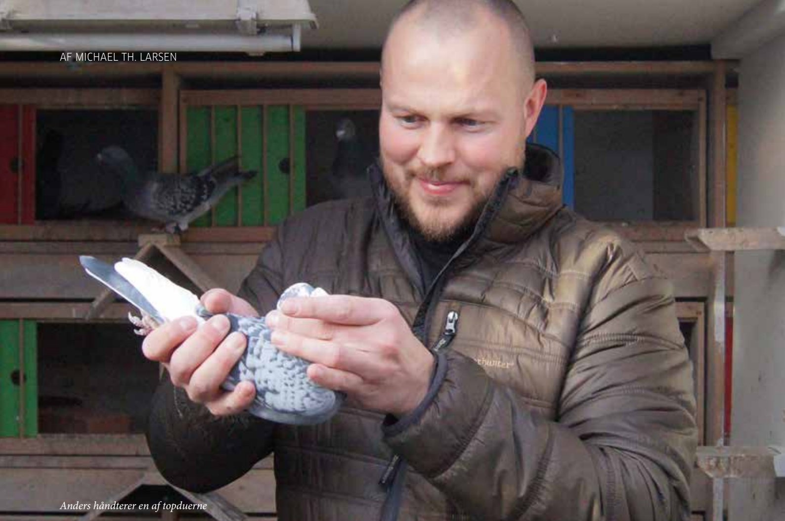
Anders håndterer en af topduerne